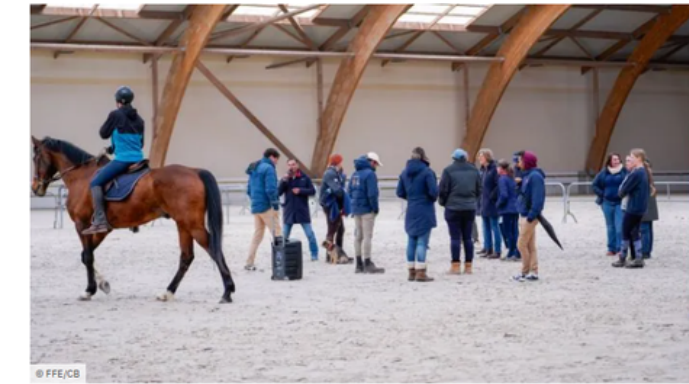
Plan Coach 2032 : premiers retours positifs sur les Journées Fédérales des Entraîneurs